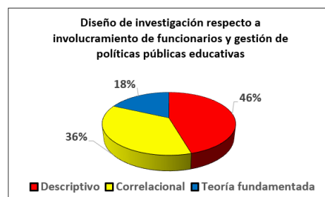
Figura 4: Diseño de investigación respecto a involucramiento de funcionarios y gestión de políticas públicas educativas.