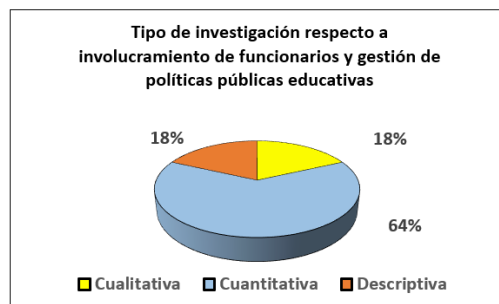
Figura 2: Tipo de investigación respecto a involucramiento de funcionarios y gestión de políticas públicas educativas.