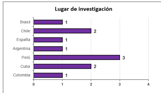
Figura 5: Lugar/país de investigación respecto a involucramiento de funcionarios y gestión de políticas públicas educativas.