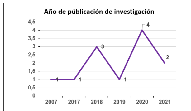
Figura 6: Año de publicación de investigación respecto a involucramiento de funcionarios y gestión de políticas públicas educativas.

En esta dimensión se analiza el año de investigación y año de publicación, en este aspecto se tendrá en cuenta que en algunos casos el año de publicación difiere del año de investigación, en ese sentido se tendrá en cuenta el año de publicación para presentar los resultados siguientes. Como se aprecia en la figura 6, se nota que en el año 2007 se realizó una investigación relacionada a las variables en estudio, mientras que en los últimos años fueron incrementándose el número de investigaciones encontradas, fomentando la investigación de políticas públicas.