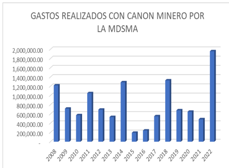
Figura 2: Gastos realizados por Canon minero por la MDSMA.

Asimismo, se puede observar que en el periodo del 2008 al 2022 durante todos los años se ha invertido en saneamiento, así como en planeamiento, gestión y reserva de contingencia donde se encuentran los gastos que corresponde al 20% de mantenimiento de infraestructura y 5% de estudios, por consiguiente, el 75% ha sido invertido en las diferentes funciones como se puede observar en la tabla 3; al respecto es necesario explicar que el 5% de canon minero, generalmente se utiliza para la elaboración de fichas o perfiles que serán utilizadas para la gestión de su financiamiento por otras entidades, una vez culminada las obras de saneamiento quedan a disposición de las JAAS para que toda la población beneficiada tenga acceso a estos servicios (Victor Marcos y Santa María, 2021).