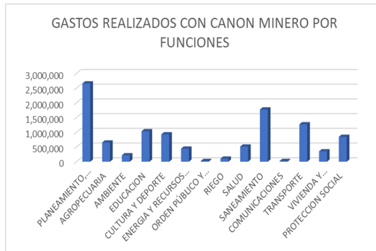
Figura 3: Gastos realizados por Canon minero por funciones.

Teniendo en consideración las necesidades de la población, las autoridades y funcionarios han tomado las decisiones para priorizar el uso del canon minero en el distrito de San Miguel de Aco, tal es así que sus prioridades han sido invertir en saneamiento, transporte, educación, cultura y deporte, protección social, salud, energía, ambiente, entre otros, como se puede observar en la figura 3. Para la priorización de la ejecución de gastos con los recursos de canon minero se ha efectuado a través de la gobernanza y con la participación ciudadana en los presupuestos participativos y multisectoriales, sobre el particular, Caldas et ál. (2021) manifiestan que con el diálogo se puede apoyar para que exista una buena gobernabilidad y con ello se logre el desarrollo de los pueblos.