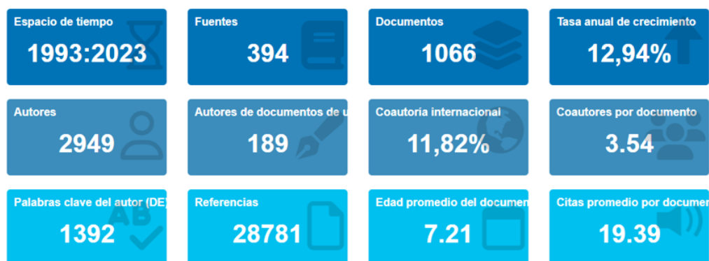
Figura 1: Información principal de la colección de metadatos sobre violencia laboral en enfermería.

El análisis bibliométrico revela una tendencia creciente en la investigación sobre la violencia laboral en enfermería a lo largo de los años. Existe una colaboración internacional significativa en este campo, y los estudios realizados mantienen su impacto y relevancia a lo largo del tiempo. Por otro lado, la cantidad de citas recibidas por estos documentos nos indica un interés y reconocimiento por parte de la comunidad científica. Estos hallazgos proporcionan una visión científica y rigurosa sobre el tema, permitiendo identificar tendencias y patrones notables en la investigación sobre la violencia laboral en enfermería.