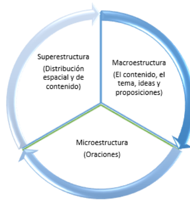
Figura 2: Organización del texto.