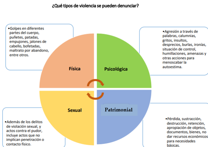
Figura 1: Tipos de violencia que se pueden denunciar.

Por lo general, los hogares donde se observa a grandes rasgos las agresiones domésticas poseen un factor fijo o de jerárquica. Asimismo, cada integrante de la familia no tiene fluidez social y familiar es por esto que se observa en diversos casos que los individuos no desarrollan su propia identidad, ni mucho menos se relación familiarmente, es decir, no existe ese lazo familiar por la cual se debe querer y respetar entre ambos. Los seres humanos que experimentan violencia doméstica en situaciones críticas muestran flaquezas no solo físicamente sino psicológica y emocionalmente, conduciendo a esto a innumerables problemas de salud en la sociedad estando la más común la depresión y enfermedades cerebrales (Salazar, C. & Mayor, S. 2019). Estos individuos también manifiestan a través de su comportamiento un bajo y preocupante rendimiento laboral. En los menores de edad los problemas suelen presentarse por medio de problemas educativos, trastornos severos de personalidad, entre otros. Por lo común, las víctimas afectadas por la violencia doméstica, que crecieron en esta situación, tienden a reproducirla en sus futuras relaciones (Hurtado, C. & Serna, A. 2012). En la figura 2 se aprecian los espacios donde se produce la violencia.