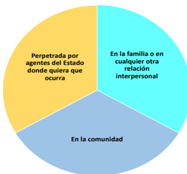
Figura 2: Espacios donde se produce la violencia.