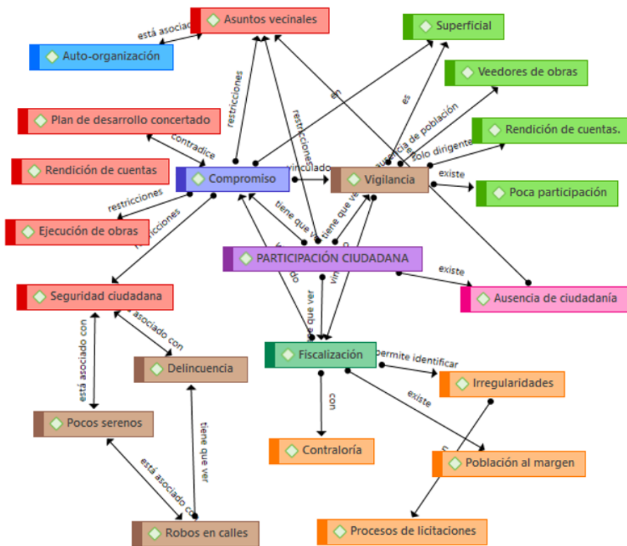
Figura 3: Participación ciudadana en una municipalidad distrital de Lima Metropolitana.

Los resultados de la investigación en cuanto a la tercera categoría: participación ciudadana (figura 3), que consiste en que la gestión edil convoque a la ciudadanía para participar directamente en los asuntos vecinales, así como en el plan de desarrollo concertado, en la rendición de cuentas, en la ejecución de las obras y en la seguridad ciudadana, se reporta que hay ausencia de la ciudadanía en asuntos los ediles que deben estar orientados en la mejora del distrito y se brinde bienestar a la población. Si bien los dirigentes vecinales presentan expedientes técnicos provenientes de los barrios, urbanizaciones, cooperativas, asentamientos humanos y asociaciones, estos planes no recogen necesariamente las necesidades de la población por cuanto los proyectos son elaborados por un reducido número de personas. En cuanto a la fiscalización que compete a la ciudadanía en un gobierno edil democrático, transparente y orientado al bienestar humano, esto no se da de manera recurrente, ni profunda ni adecuada.